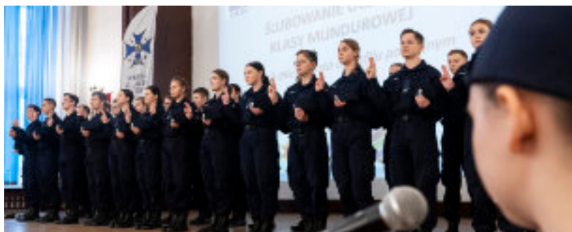
► Uroczyste ślubowanie

Profile mundurowe w ZSEU zostały utworzone po raz pierwszy