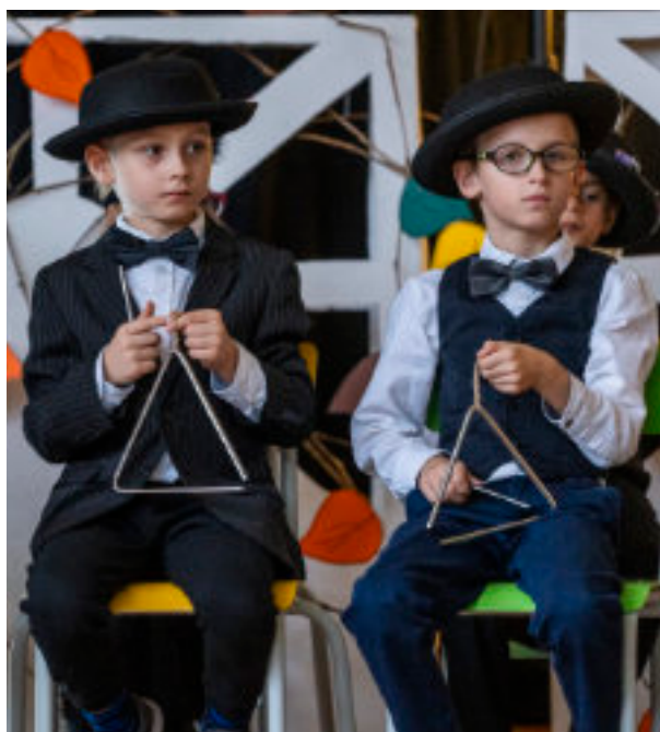
► Uczniowie zaprezentowali swoje talenty

ZABRZAŃSKA PODSTAWÓWKA OTRZYMAŁA IMIĘ WIELKIEJ ORKIESTRY ŚWIĄTECZNEJ POMOCY