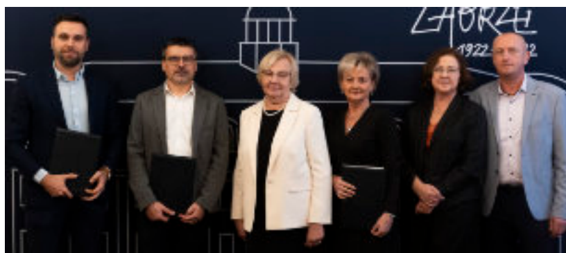
► Podpisanie umowy na remont drogi

Wartość podpisanej umowy to prawie 3 mln zł. Prace obejmą wymianę warstw bitumicznych, napra-