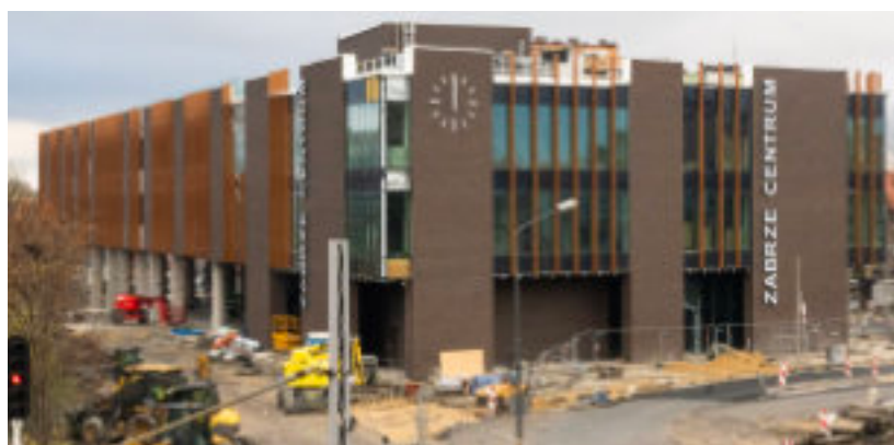
► Centrum przesiadkowe przy ul. Goethego