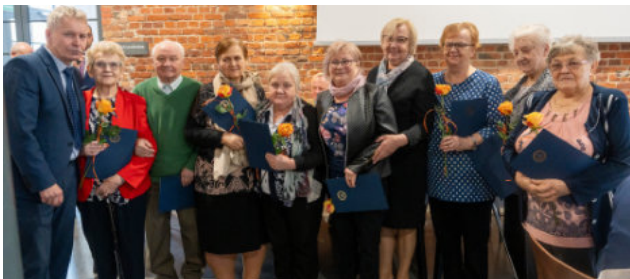
► Okolicznościowe spotkanie odbyło się w Łażni Łańcuskowej Sztolni Królowa Luiza