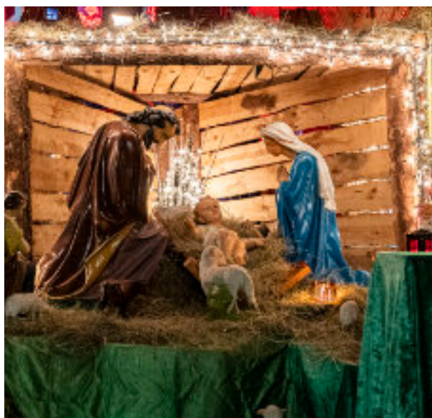
► Fot. UM Zabrze