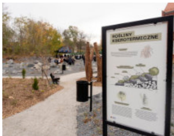
► Nowy skwer przy ul. Cmentarnej