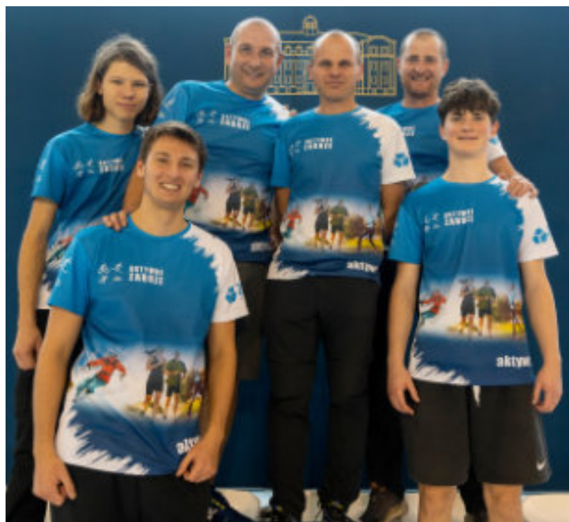
► Zawody zostały zorganizowane przez stowarzyszenie Aktywne Zabrze