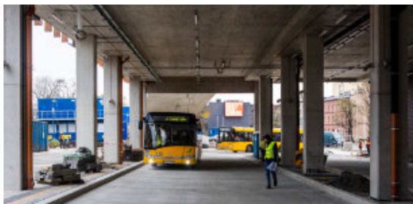
► W listopadzie odbywały się tu jazdy testowe autobusów