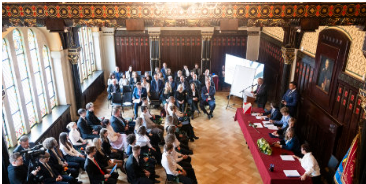
► Uroczysta sesja Młodzieżowej Rady Miasta odbyła się w odrestaurowanej sali witrażowej Muzeum Górnictwa Węglowego