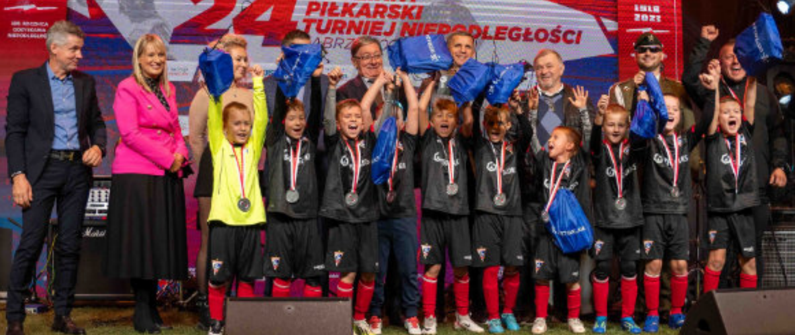
► Młodzi piłkarze nie kryli radości z sukcesu