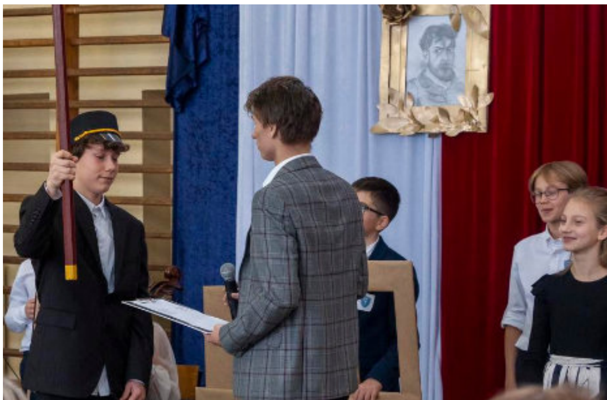
► Przygotowany przez uczniów program artystyczny

SZKOŁA PODSTAWOWA NR 7 DZIAŁA JUŻ OD 40 LAT