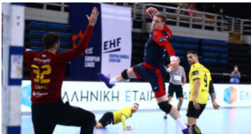
► Jedna z efektywnych akcji

Kto będzie grupowym rywalem zabrzan? Legendy! Pewnym awansu są bowiem zarówno bundesligowe Rhein-Neckar Löwen, jak i francuskie HBC Nantes. Oba zespoły są jednymi z faworytów całych rozgrywek, w końcu na swoim koncie mają udział w Final4. Choć tylko Lwy mogą pochwalić się zwycięstwem w Pucharze EHF (poprzedniku Ligi Europejskiej). Ale to odległa historia, bo do tego sukcesu doszło ponad 10 lat temu, w sezonie 2012/2013.