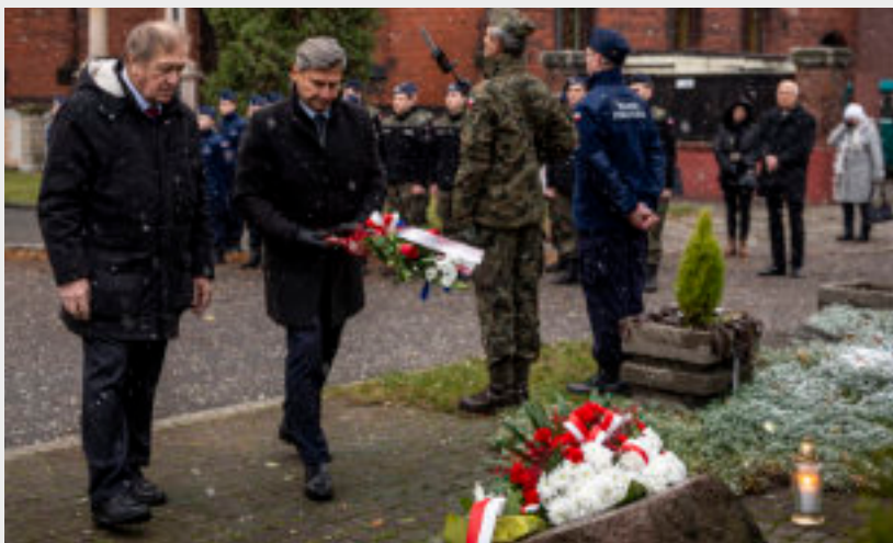
► Uczestnicy obchodów składają kwiaty

Nowego w Zabrzu. Obchody zakończył koncert lwowskich pieśni w wykonaniu kresowego barda – Andrzeja Szczepańskiego. GOR