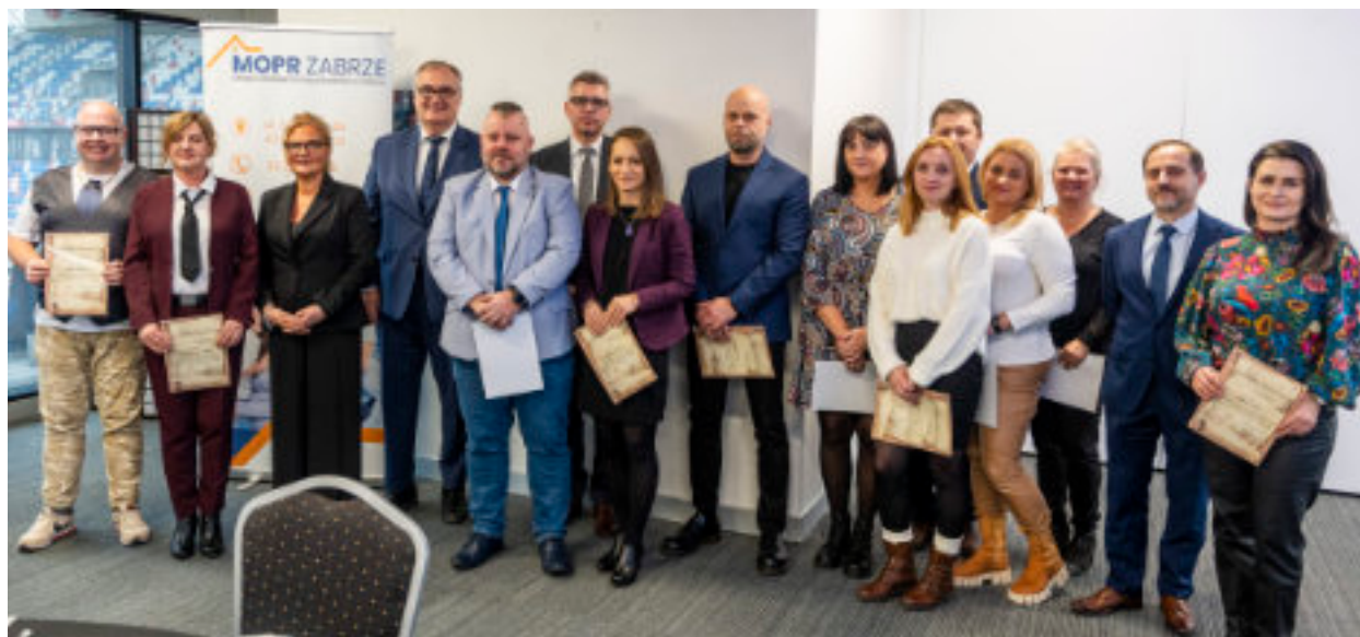
► Dzień Pracownika Socjalnego był okazją do wręczenia awansów i wyróżnień

Na co dzień otaczają opieką osoby chore, samotne, starsze, zepchnięte na margines. Wyciągają pomocną dłoń, gdy wszystko inne zawodzi. W listopadzie obchodziliśmy Dzień Pracownika Socjalnego.