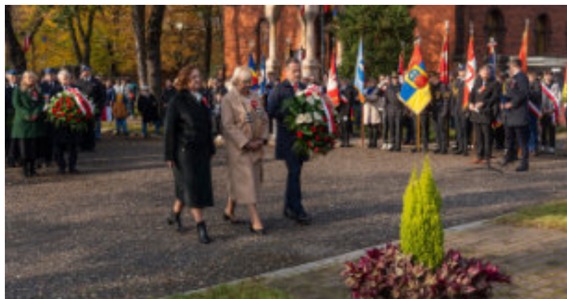
► Kwiaty składa prezydent Zabrza ze swoimi zastępcami