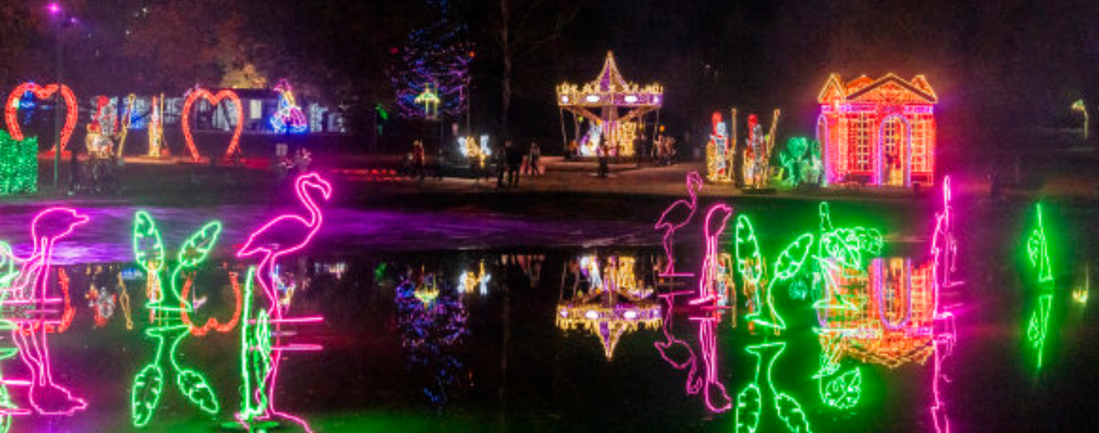
► Niezwykle efektowne iluminacje w Parku Miliona Świąteł

TE MIEJSCA WARTO ODWIEDZIĆ Z CAŁĄ RODZINĄ