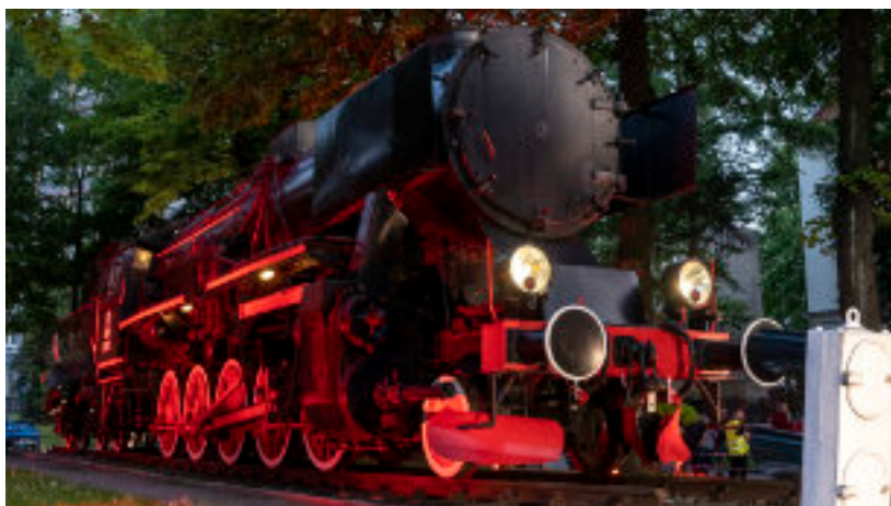
► Zabytkowa lokomotywa przed siedzibą DB Cargo Polska

Przypomnijmy, że Dzień Kolejarza przypada 25 listopada, w dniu