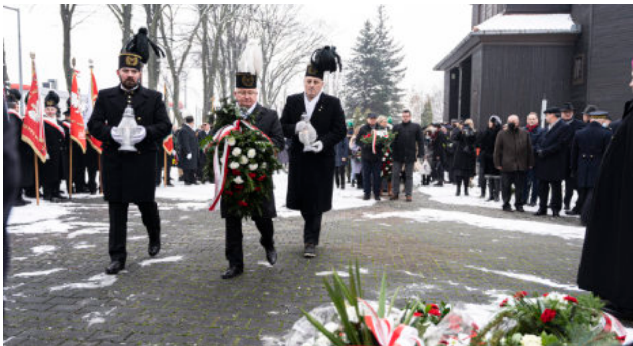
► Coroczne uroczystości w parafii św. Jadwigi