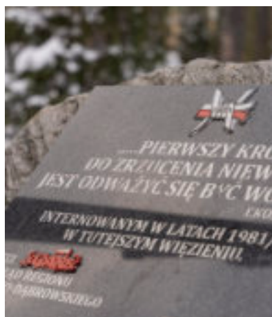
► Pamiątkowa tablica

Na terenie parafii św. Jadwigi, przy ul. Janika, mieści się zakład