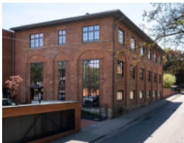
► Centrum Usług Społecznych