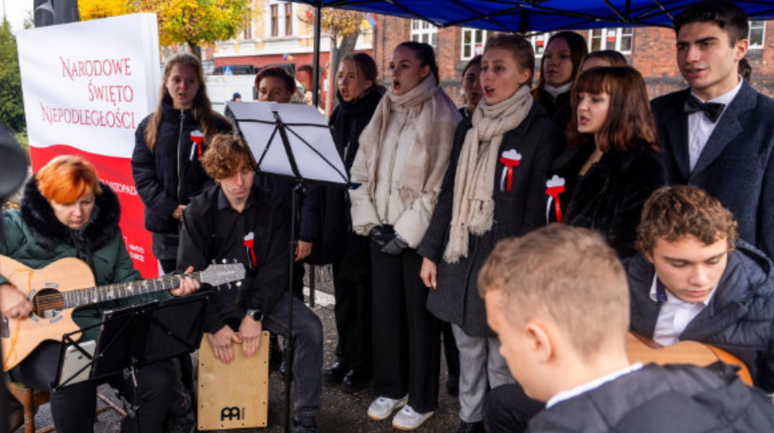
► Zaprezentowana przez uczniów etiuda artystyczna „Szkicownik Polski”