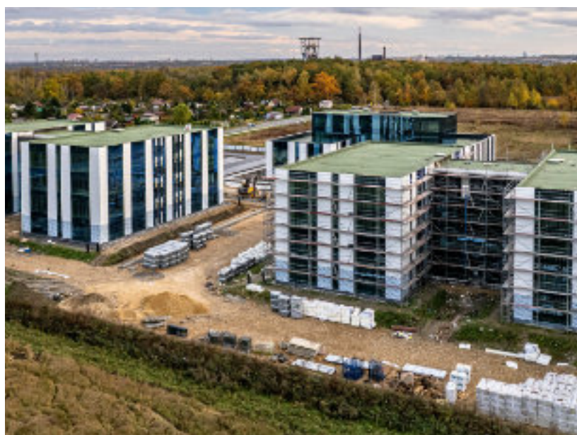
► Nowa siedziba firmy ZARYS

W ramach projektu przebudowana zostanie także ul. Bytomska. W rejonie pętli tramwajowej przy skrzyżowaniu z ul. Szyb Wschodni powstanie rondo. GOR