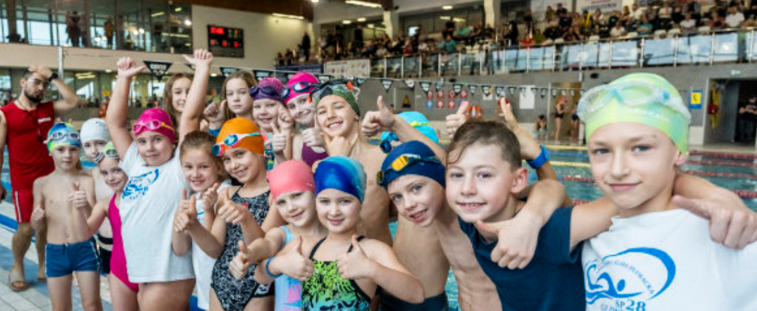
► Młodzi pływacy w kompleksie Aquarius Kopernik