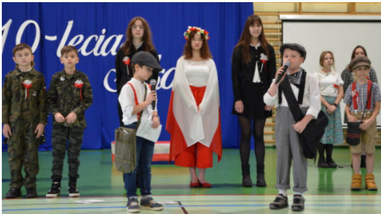
► Przygotowany przez uczniów program artystyczny