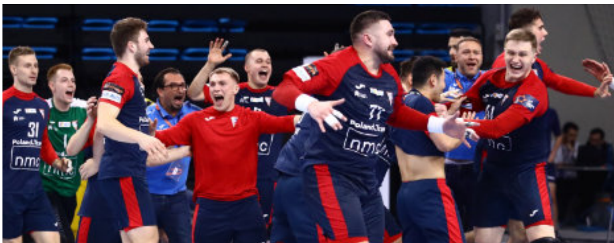
► Radość po zwycięstwie