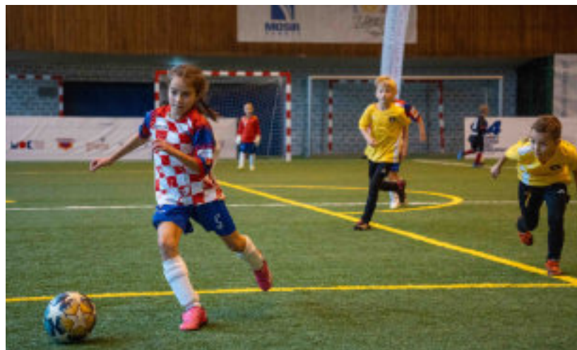
► Turniej rozegrano na profesjonalnej murawie w hali MOSiR