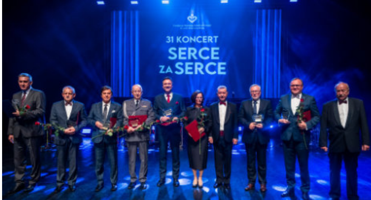
► Laureaci na scenie Domu Muzyki i Tańca