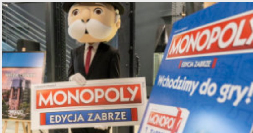
► Zabrzańska edycja gry to z pewnością ciekawy pomysł na prezent

kalnych. Na całym świecie sprzedano ponad 200 mln egzemplarzy gry. GOR