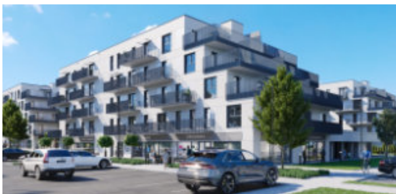
► Tak mają wyglądać gotowe budynki Wiz. TDJ Estate

– Projekt architektoniczny osiedla „Zielona Dolina” w pełni wykorzystuje atuty miejsca, w którym powstaje. Wybudowane mieszkania spełniają wymagania współczesnych nabywców. Działania spółki TDJ Estate są spójne z obowiązują-