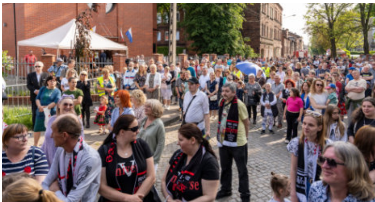
► Dzielnica tętni życiem - na zdjęciu wakacyjny festyn