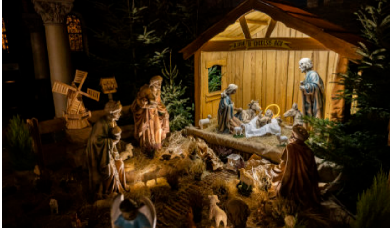
► Fot. UM Zabrze