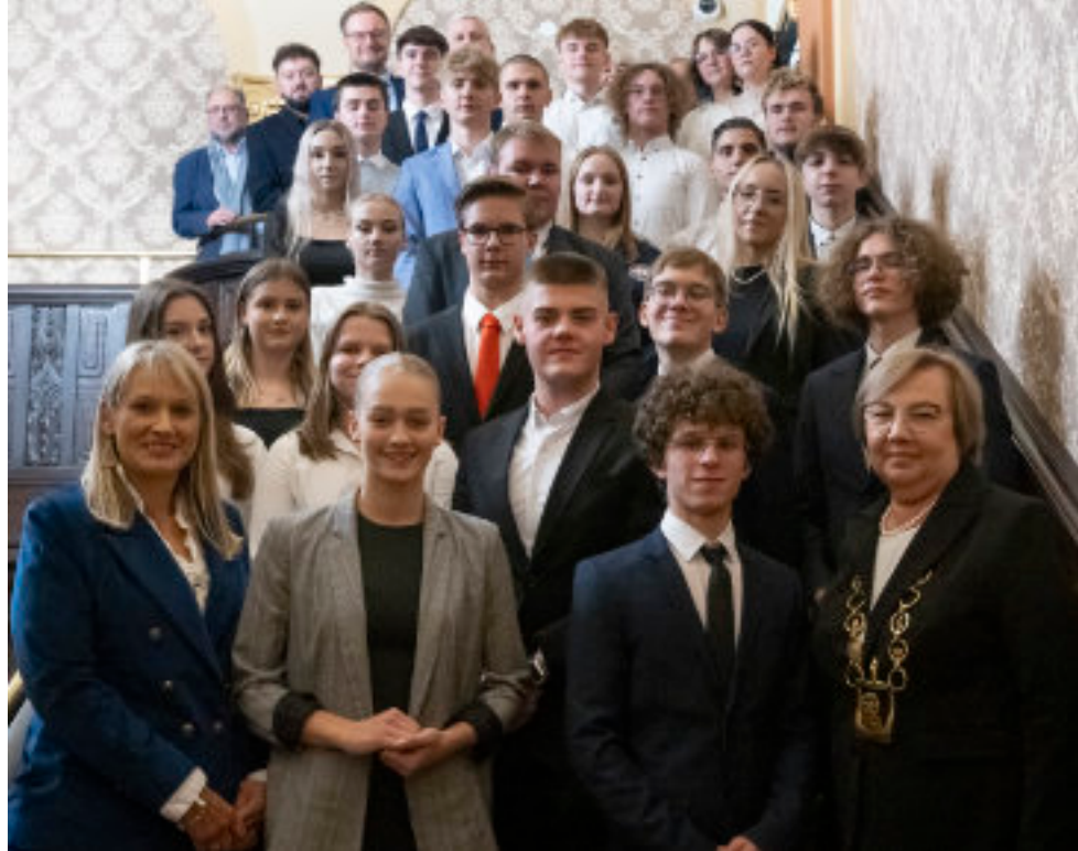
► Młodzi radni z przewodniczącą Rady Miasta i prezydent Zabrze