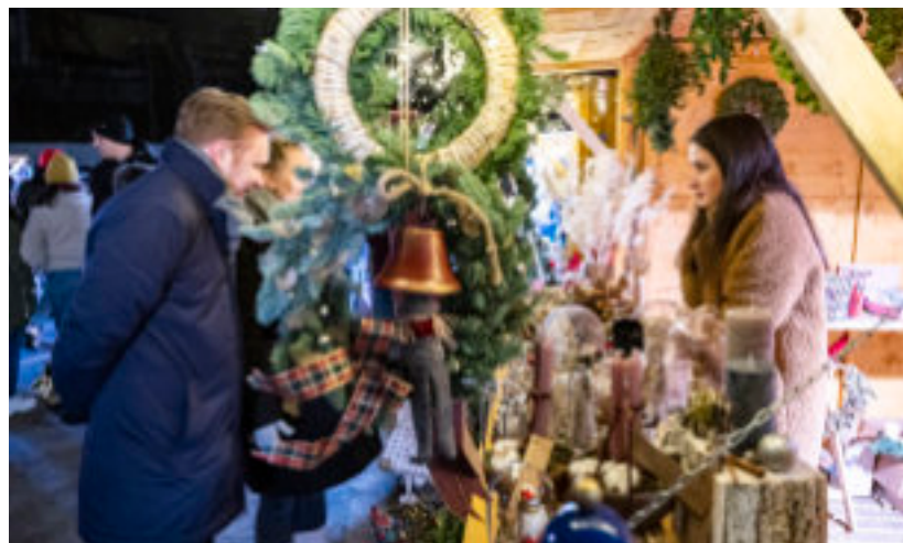
► Przedświąteczne jarmarki to już w Zabrzu tradycja

niespodzianek dla zakochanych. Iluminację będzie można odwiedzać do 14 lutego 2024 r., od wtorku do niedzieli oraz w poniedziałek 25 grudnia i 1 stycznia. Więcej informacji oraz bilety na www.parkmilionaswiatel.pl . GOR